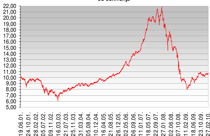
Kretanje vrijednosti udjela SELECT EUROPE od osnivanja